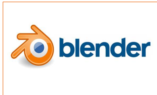
Gambar 2. Logo Blender

Teknologi yang digunakan dalam pelatihan ini adalah Blender 3D. Blender merupakan software pengolah 3 dimensi (3D) untuk membuat animasi 3D, yang bisa dijalankan di windows, macintosh dan linux. Blender juga dapat membuat game karena memilik Game Engine. (Rori dkk, 2016).