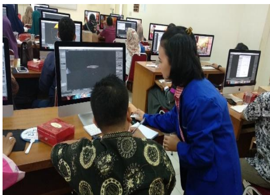
Gambar 5. Mahasiswa membantu peserta selama kegiatan

Selama pelaksanaan kegiatan peserta menunjukkan bagaimana antusias mereka dalam workshop yang dilakukan.