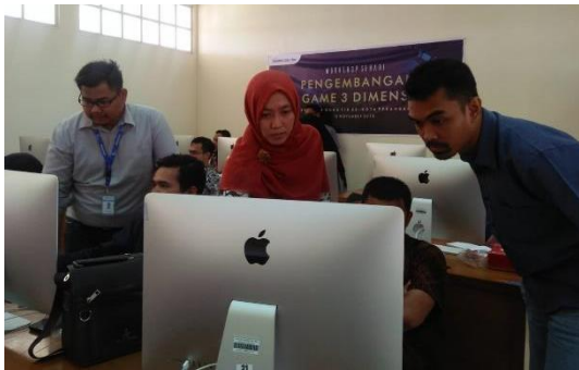
Gambar 4. Dosen terlibat dalam kegiatan ini

Selama pelaksanaan kegiatan peserta menunjukkan bagaimana antusias mereka dalam workshop yang dilakukan.