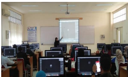
Gambar 6. Asisten Instruktur ikut serta dalam sharing ilmu

Diakhir acara, salah satu peserta yang mewakili mitra mengucapkan terima kasih untuk Politeknik Caltex Riau dan tim penyelenggara untuk kegiatan positif dan berkesinambungan ini. Mitra juga memberikan saran agar kegiatan ini bisa diadakan rutin setiap tahun agar kerjasama ini tetap terjalin dengan baik.