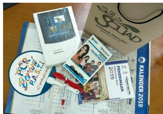
Gambar 3. Modul dan Seminar Kit Peserta

Selain modul praktikum, tentunya material pelatihan yang dipersiapkan adalah alat tulis serta souvenir agar mendukung peserta pelatihan untuk mengikuti kegiatan dengan baik dan lebih menyenangkan.