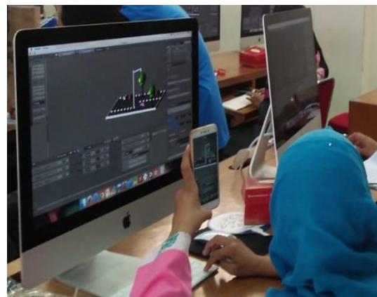
Gambar 7. Produk Hasil Pelatihan

Hasil luaran yang menjadi target capaian dalam kegiatan ini adalah para guru dapat mengembangkan sebuah produk permainan edukasi yang dapat dimanfaatkan sebagai media ajar yang menarik. Berdasarkan hasil kegiatan, dapat terlihat bahwa setiap guru yang menjadi peserta sudah berhasil membuat permainan edukasi dengan menggunakan teknologi Blender, meskipun sederhana namun tetap syarat akan nilai pembelajaran yang dapat diimplementasikan serta diteruskan untuk dieksplorasi lebih dalam lagi. Berikut pada gambar 7 merupakan salah satu bukti dari keberhasilan peserta dalam mengembangkan sebuah produk permainan edukasi.