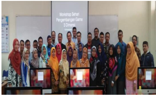
Gambar 9. Foto bersama Peserta dan Instruktur

Kebermanfaatan PCR sebagai institusi pendidikan tinggi semakin terasa oleh masyarakat sekitar, khususnya mitra yang berada di area kampus, yaitu Kota Pekanbaru. Hal ini tentu semakin menambah nilai positif PCR bagi masyarakat umumnya, serta Tim Dosen dan pelaksana juga pada khususnya.