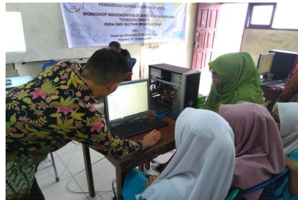
Foto 4.3. sesi bertanya oleh peserta workshop

Hasil Evaluasi terhadap kegiatan Workshop Mikrokontroler AVR Untuk Menunjang Teknologi Digital Pada SMK Sulthan Muazzam Syah. dengan meningkatnya minat dan pengetahuan siswa akan mikrokontroler AVR, dan aplikasi proteus. Workshop ini memberikan sesi praktikum dan evaluasi hasil pembuatan aplikasi proteus oleh siswa-siswi SMK Sulthan Muazzam Syah. Hasilnya terpilih siswa-siswi yang dapat menjawab pertanyaan dan menyelesaikan praktikum dengan baik dan benar.