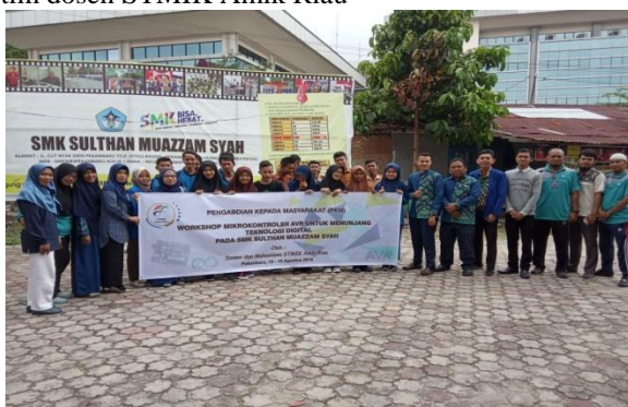
Foto 4.2. foto bersama peserta workshop

Foto bersama peserta Workshop disampaikan oleh tim dosen STMIK Amik Riau