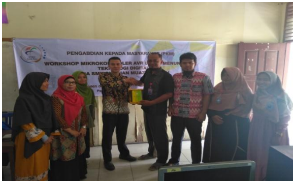
Gambar 4.1 foto penyerahan plakat bersama kepala sekolah

Foto bersama peserta Workshop disampaikan oleh tim dosen STMIK Amik Riau